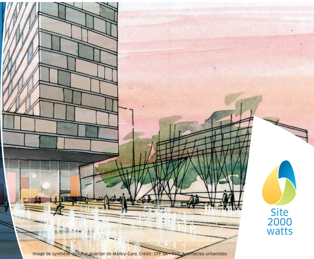
Image de synthèse du futur quartier de Malley-Gare. Crédit: CFF SA - FHV Architectes-urbanistes

Plus d'informations www.2000watt.ch/malley-gare